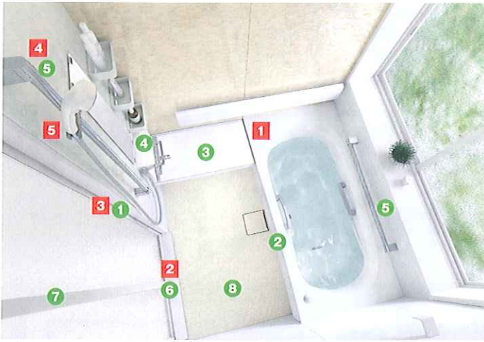
システムバスルーム サザナ 1坪サイズ Fタイプ 写真セット価格 1,666,100円(税・工事費別)