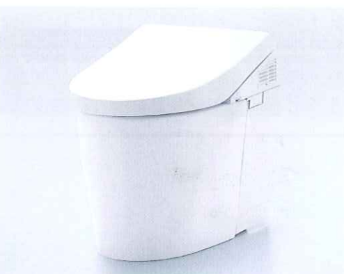
ネオレストAH 希望小売価格 334,000円(税・工事費別)